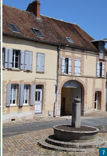
6. Le Prétoire et le monuments aux morts de 1870 / 7. La rue Pierrefrite